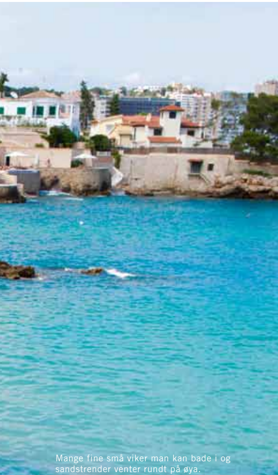
Mange fine små vikar man kan bade i og sandstrender venter rundt på øya.