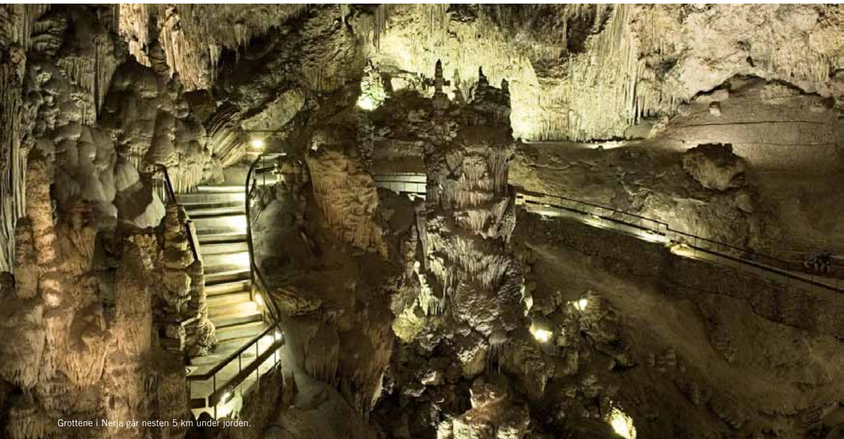
Grottene i Nerja går nesten 5 km under jorden.

N år sensommeren nærmer seg setter spanjolene ned tempoet. Trafikkstresset forsvinner med varmebølgen, og turistrvimelen blir mindre påtagelig. Den spanske atmosfæren titter fram etter en lang siesta og Costa del Sol viser seg fra sin rette side – den siden som en gang lokket de første turistene hit. Vannet er fremdeles temperert og badevennlig. Solen varmer på stranden, men nå er stemningen roligere. Sangriaen smaker bedre når det fins sitteplass i baren!