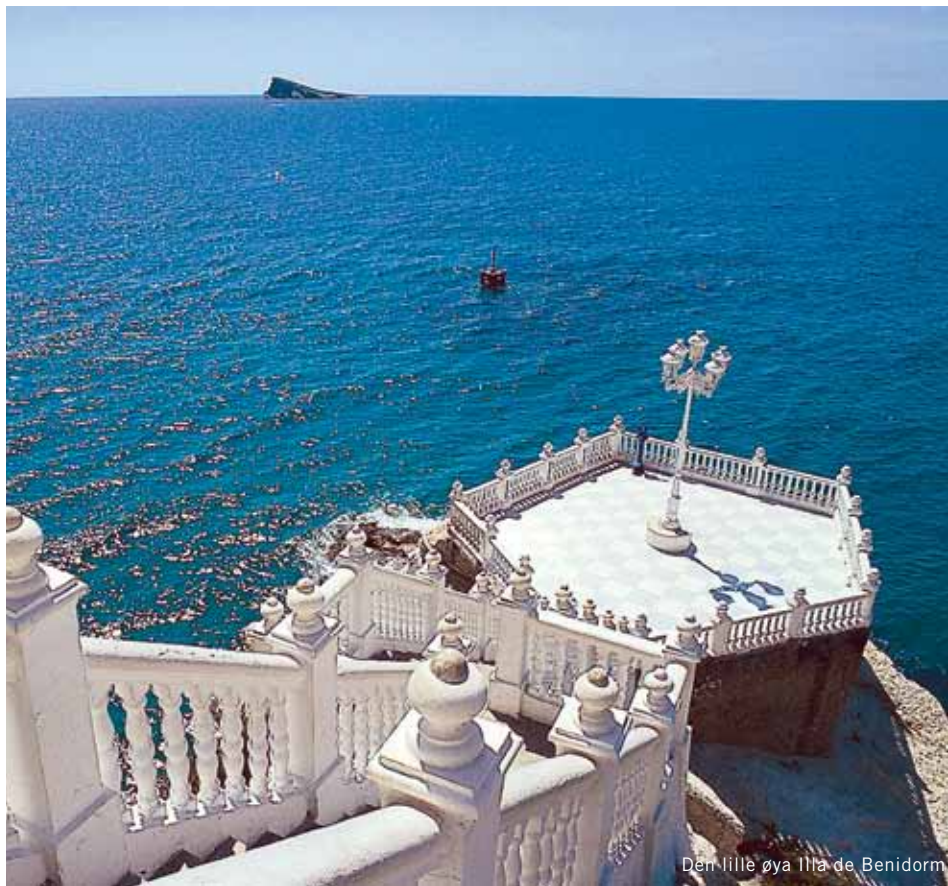
Den lille øya Illa de Benidorm

N avnet Costa Blanca ble lansert som et reklameslogan av et flyselskap på slutten av 50-tallet. I dag er det et navn som signaliserer sol, bad og ferie.