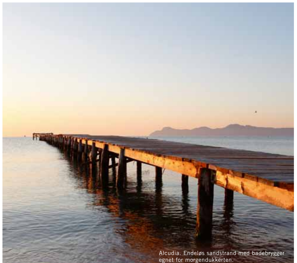
Alcudia. Endeløs sandstrand med badebrygger egnet for morgendukkeren.

Bahía Mediterráneo (Passeig Marítim 33). Ligger i det som en gang var Palmas fineste hotell. Byr på både en storslagen utsikt samt flott mat og service. Hva er best? Utsikten fra restaurantens sommeråpne terrasse! Vakker som et postkort. Ikke glem kameraet! ●