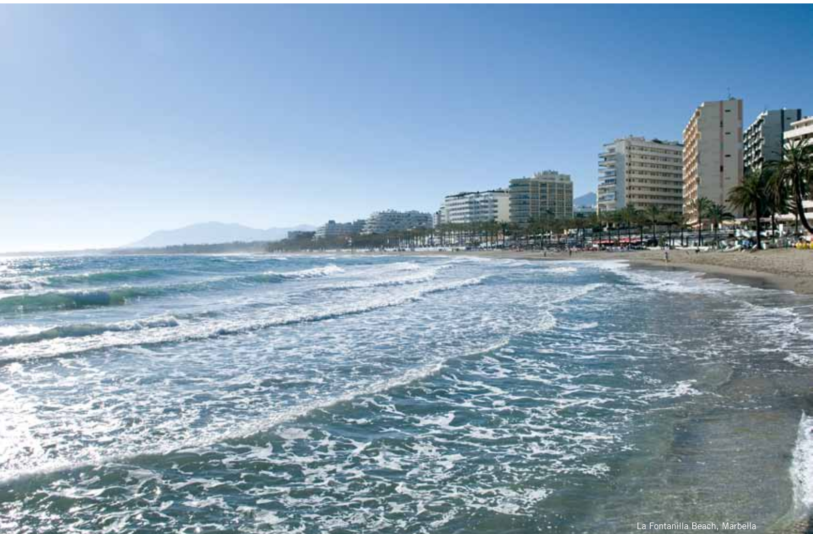
La Fontanilla Beach, Marbella