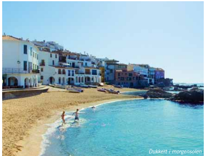
Dukkert i morgensolen