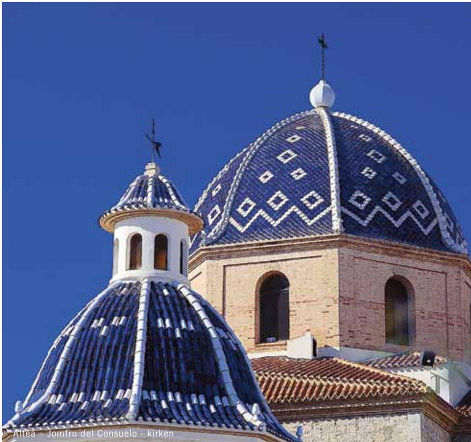
Altea – Jomfru del Consuelo - kirken