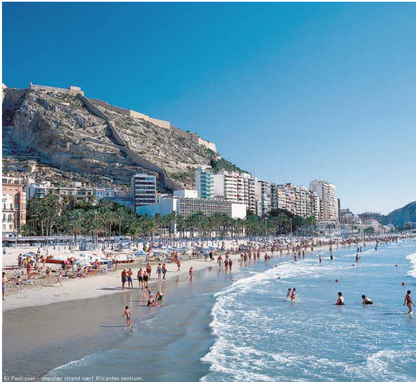
El Postiguet – populær strand nært Alicante sentrum.