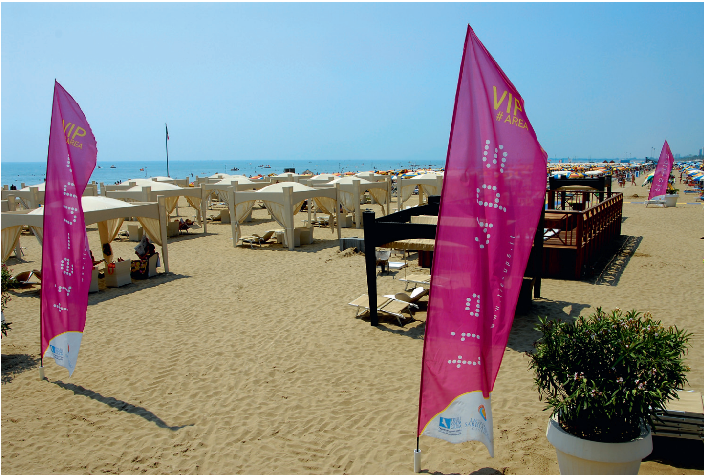
På den kilometerlange sandstranden i Lignano fins det plass til alle.

I talias 80 mil lange kyststripe langs Adriaterhavet strekker seg fra Trieste i nord til Otranto i sør. Her ligger de kjente badebyene som perler på en snor, Grado, Bibione, Rimini og Riccione, og lokker med innbydende strender, pittoreske gamlebyer og førsteklasses restauranter. Langs kysten finner man koselige byer i et storslått fjellandskap, historiske rester fra romertiden og kulturbyer som Ravenna, et kunsthistorisk sentrum i verdensklasse.