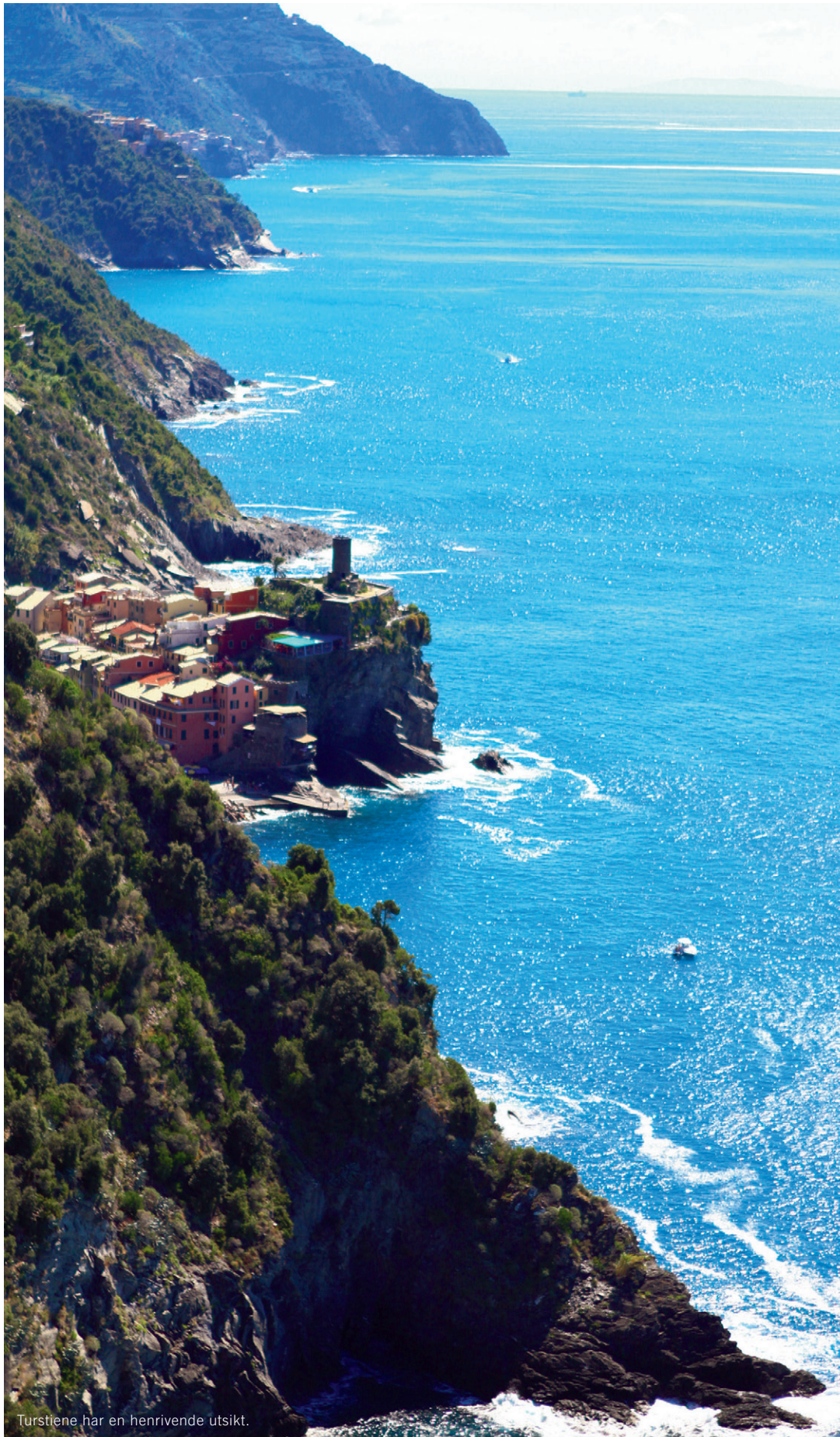
Turstiene har en henrivende utsikt.