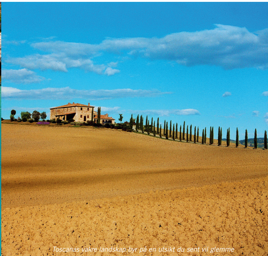
Toscans vakre landskap byr på en utsikt du sent vil glemme

det toscanske øyeriket, blant annet Italias tredje største øy, Elba. Castiglione della Pescaia domineres av en festning fra middelalderen og har en sjarm som gjør at mange italienerne har den som sin feriefavoritt. Herfra kan man gjøre mange fine utflukter innover landet og ut blant øyene.