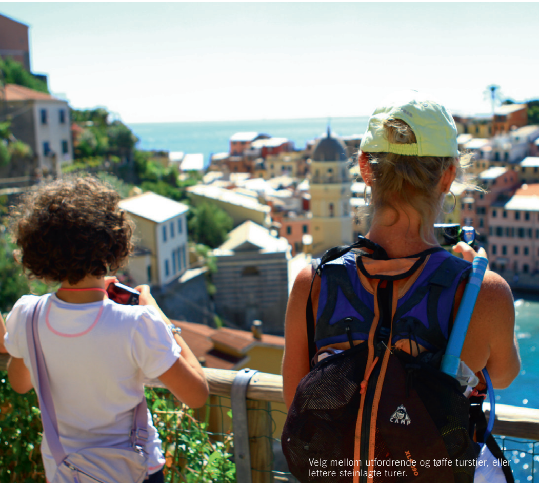
Velg mellom utfordrende og tøffe turstier, eller lettere steinlagte turer.

D et å komme til italienske Cinque Terre føles som å ta et steg inn i en dokke-teaterkulisse. Det er uvirkelig vakkert samtidig som historien er nærværende og avstanden mellom dalene, husene og torgene er mindre enn i det virkelige livet. En perfektjonistisk miniatyrverden bortenfor tid og rom, og hvor alt finnes innen kort avstand.